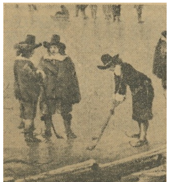
水上でゴルフを楽しむオランダ人(17世紀)

toeristen centrum, waar een driehonderd gasten aanwezig waren. De Gouverneur en Burge-meester hielden redevoeringen waarin zij hun dank aan Nederlandse Regering en volk uitspraken dat nu te Nagasaki dit Holland Huis is tot stand gekomen waar niet alleen de burgers van Nagasaki maar ook het half miljoen Japanse toeristen dat Nagasaki jaarlijks bezoekt, een goede indruk krijgen van de Nederlands-Japanse historische betrekkingen. Daarna voerde de heer Tange het woord en bood een oud Nederlands kolf-spel aan, dat gezien de Japanse belangstelling voor golf, veel interesse zal wekken. Ten slotte hield Professor Vos