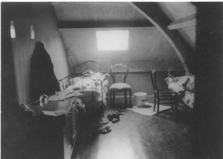
De dode kelner in bed. Achterin de stoel die de kok gebruikte om door het dakraam te klimmen

Zoals gezegd werd het in oktober 1934 geopend door Nelly Remouchamps-Burgdorffer (*1890) uit Leiden. 8 Zij was de weduwe van 'een be-