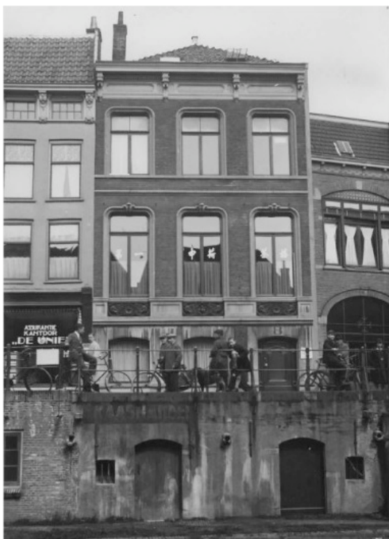
Het Chinees restaurant, Lichte Gaard 8, 1935